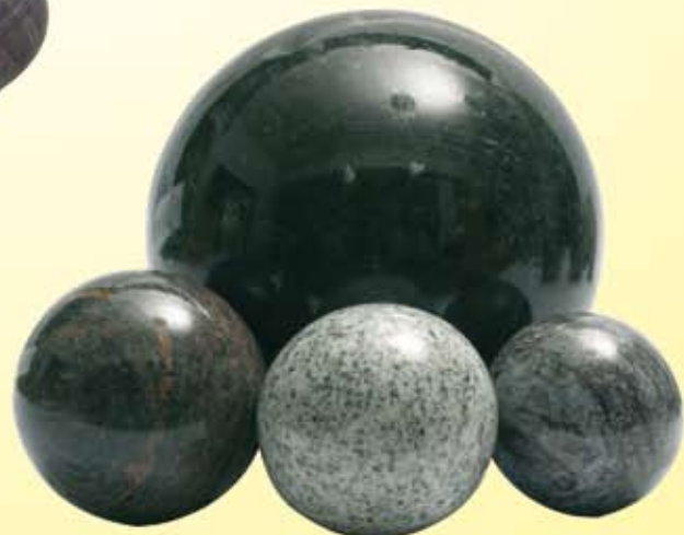
Koule – průměr 4 – 60 cm Kugel – Durchmesser 4 – 60 cm Ball – diameter 4 – 60 cm