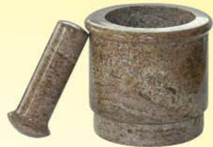
Hmoždíř Mörser Mortar