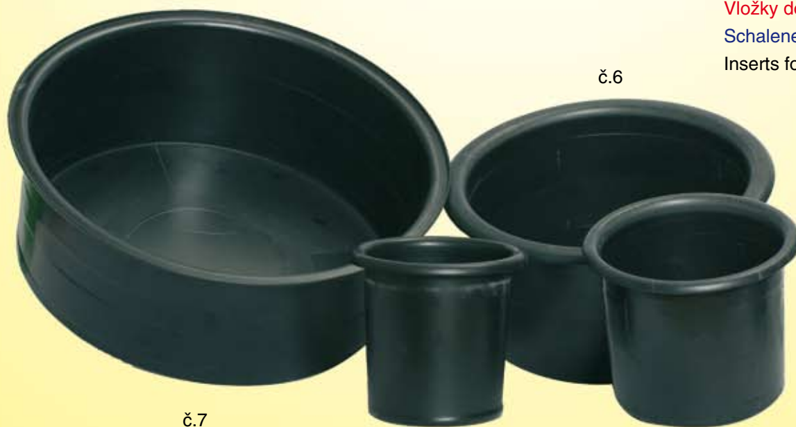
Vložky do mís Schaleneinsätze Inserts for bowls

č.4 – 120/130 č.5 – 155/140 č.6 – 245/135 č.7 – 345/135