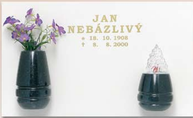
V81 – 9/14