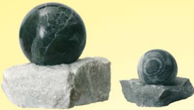
Kámen s koulí – průměr 4 – 30 cm Stein mit der Kugel – Durchmesser 4 – 30 cm Stone with the ball – diameter 4 – 30 cm