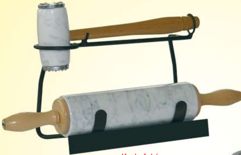
Kuchyňská souprava Küchengerät Kitchen set