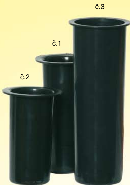
Vložky do váz Vaseneinsätze Inserts for vases